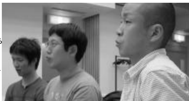
(写真) 今年8月31日に開かれた「NVC若手未来トーク&ワークショップ」

若手の活躍がますます著しい今年のNVC。彼らNVCをどう見、どう感じ、どんなふうになったらいいと考えているのでしょうか？ よし、それなら一度集まって、言いたい放題語ってみよう！ そんな集まりが実現しました。今年の冷夏をはねかえす、熱いトークの結末は？