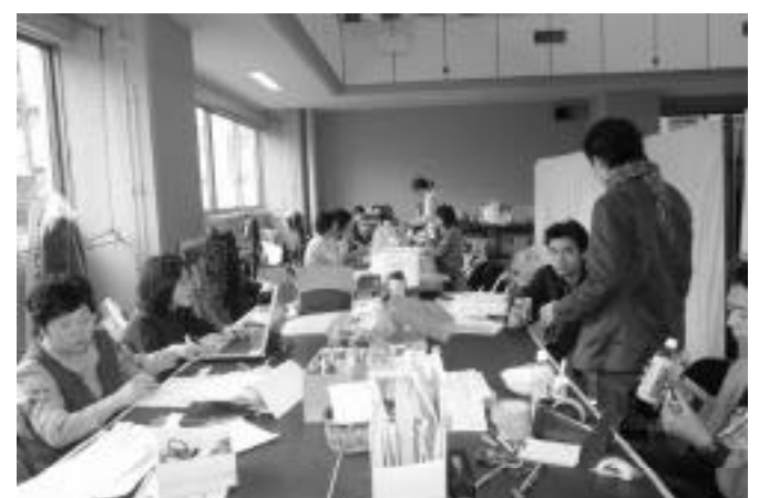
バザーの舞台裏。バックヤードを兼ねた事務局スペースは、本番真っ只中の慌ただしさに緊張感が入り混ざった空気が漂う。

ごみ処理からいろんなことが見えてきました。これは是非、全スタッフで共有して行きたいテーマだと思いませんがいかがですか？